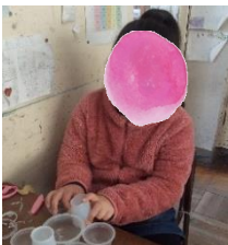
ありがとうございました。